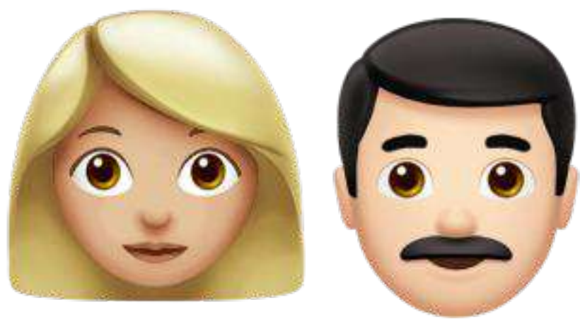
График вакцинации можно составить с терапевтом — на приёме, онлайн-консультации или в рамках чек-апа

Сделать прививку можно даже при наличии ВПЧ, вакцина защищает от четырёх или двух самых распространённых штаммов